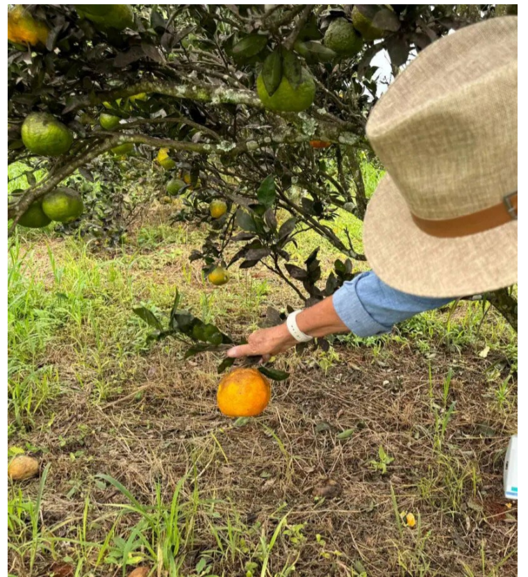
Fapeg e Emater investem R$ 4,6 milhões em pesquisa e inovação na agricultura familiar em Goiás

Podem concorrer ao edital doutores em áreas como Medicina Veterinária, Biologia, Agronomia e Engenharia Florestal, que desenvolverão pesquisas voltadas para sistemas de produção sustentável, validação de biodefensivos e biofertilizantes, e o aumento da produtividade em culturas específicas como pequi, mandioca e cereais.