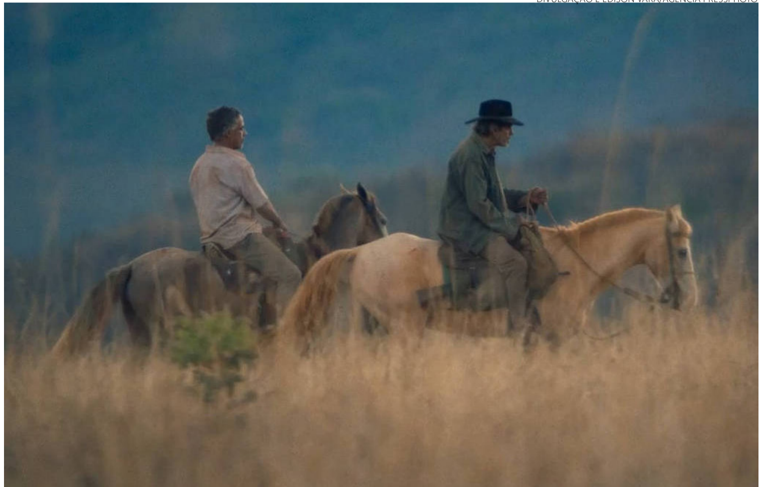
‘Oeste Outra Vez’ foi rodado na Chapada dos Veadeiros, a cerca de 400 km de Goiânia: Cerrado retratado na telona

A história se entrelaça à de outros amargurados incapazes de processar qualquer emoção e de dialogar. A raiva não é a estampa de suas personali-