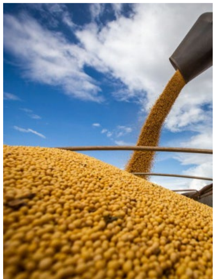
A China aumentou sua participação sobre as exportações de produtos agropecuários do Brasil, que cresceram 10% em um ano — Foto: Reprodução.

Os principais produtos exportados para a China neste ano foram soja em grãos (US$ 24,10 bilhões e 70,7% de participação), carne bovina in natura (US$ 3,05 bilhões e 8,9% de participação), celulose (US$ 2,45 bilhões e 7,2% do total), algodão não cardado nem penteado (US$ 1,17 bilhão e 3,4% do total), carne de frango in natura (US$ 745,44 milhões e 2,2% do total) e açúcar de cana em bruto (US$ 640,39 milhões e 1,9% de participação).