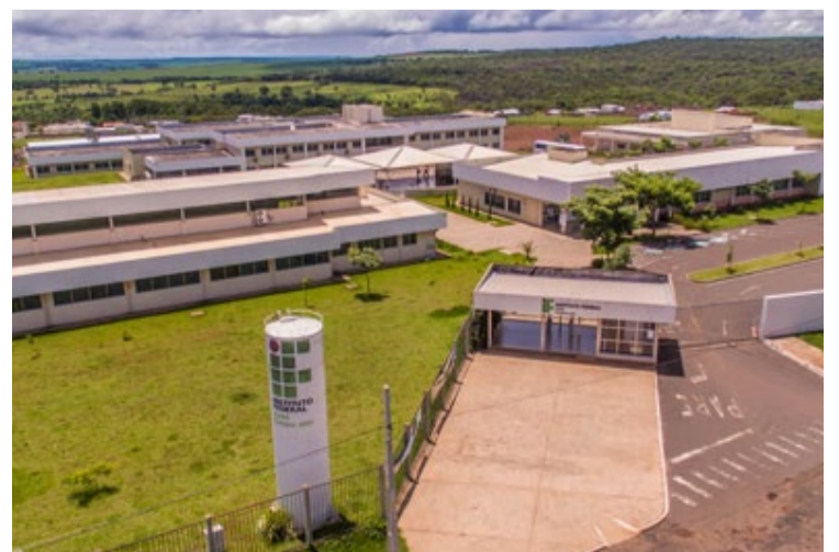
IFG de Jataí publica edital para contratação de professor substituto de libras

Conforme exposto no edital, poderá solicitar isenção da taxa de inscrição o candidato que estiver inscrito e ativo no Cadastro Único para Programas Sociais do Governo Federal - CadÚnico. O candidato que requerer a isenção, deverá encaminhar, no ato da inscrição, a Certidão atualizada que comprove o cadastramento no CadÚnico.