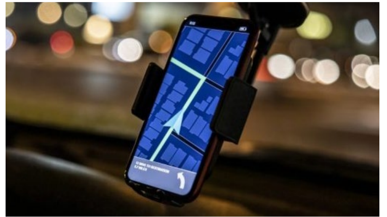
Novo sistema para cadastro de motoristas de aplicativo entrou em funcionamento na última sexta-feira, 16 de agosto — Foto: Reprodução.

Em caso de dúvida, a agência disponibiliza um canal de suporte, onde o motorista pode enviar suas dúvidas e também, registrar ocorrências pelo disque denúncia. O telefone para contato de dúvidas é 64 98163-6175. O disque denúncia do Cotran é 64 99204-9181.