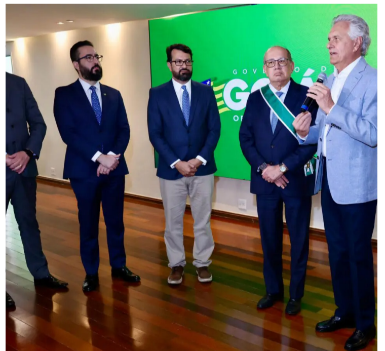
Ronaldo Caiado, Gilmar Mendes e autoridades