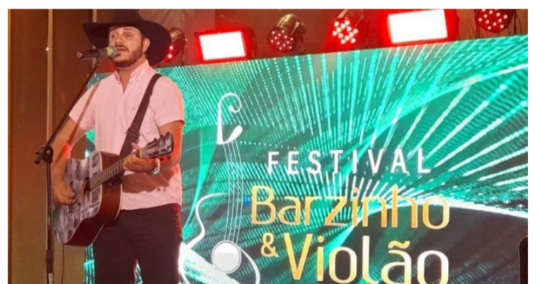
Festival Barzinho e Violão: resultado final será divulgado na Sudoexpo 2024