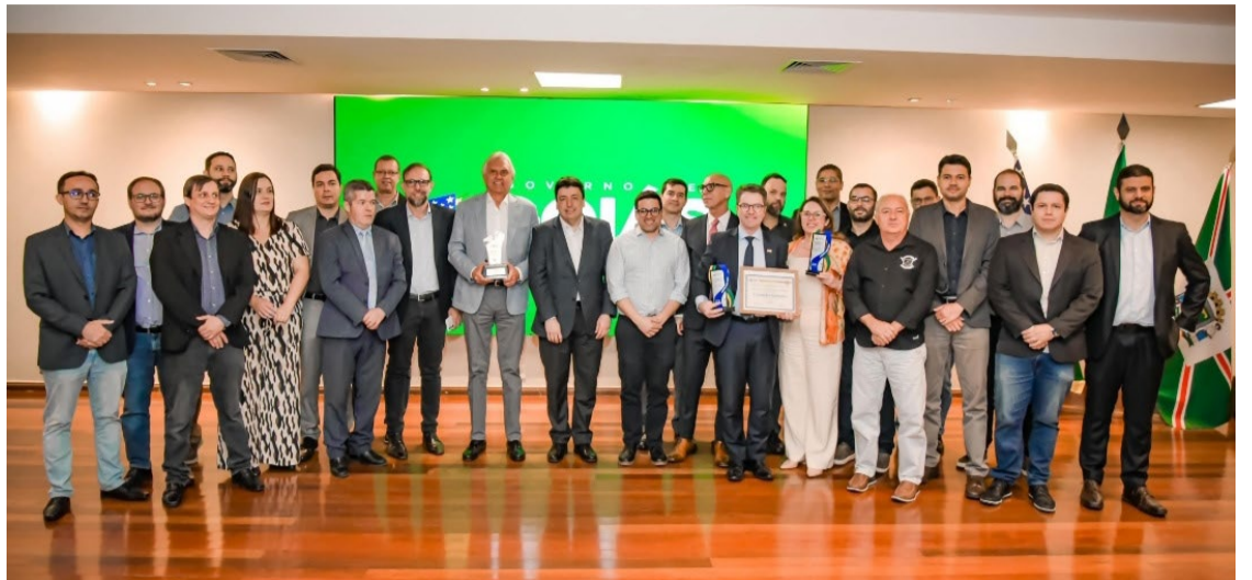
Ronaldo Caiado se encontra com servidores da TI: prêmio de estado mais digital do Brasil

Durante encontro com o pessoal da área de Tecnologia de Informação (TI), Caiado agradeceu os avanços. “O que temos na área de transferência de dados e de serviços digitais levou a avanços substantivos na educação, na segurança, e em programas sociais. Agora, não podemos diminuir o ritmo de maneira alguma”, disse o governador. Caiado pediu empenho aos especialistas para que utilizem as ferramentas de inte-