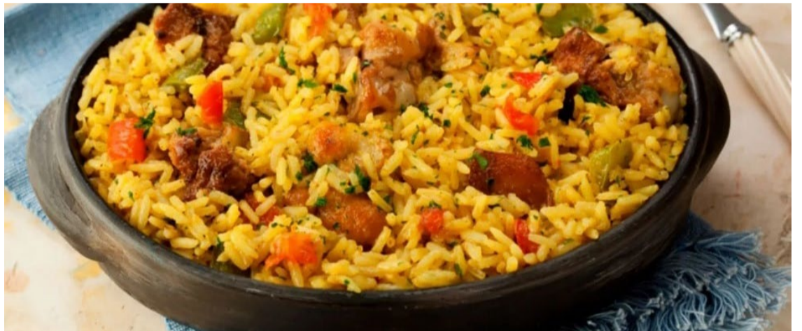
A Galinhada dos Campeões acontece neste domingo, 25 de agosto — Foto: Reprodução.

É importante frisar que os moradores podem optar pelo serviço de delivery, pedidos deverão ser realizados pelos números: (64) 9 9942-8786, (64) 9 9963-1125, ou (66) 9 9626-5934.