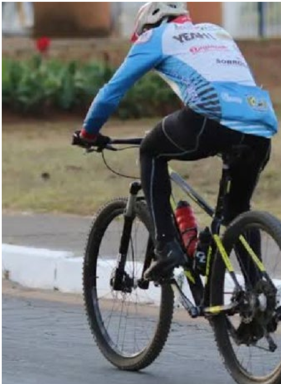
Ciclista querem respeito: metrópoles tornaram-se espaço de prática sustentável de transporte consciente e saudável

Comemora-se nesta segunda-feira, 19, o Dia Nacional do Ciclista. Goiânia é uma das capitais com maior prática do transporte sustentável