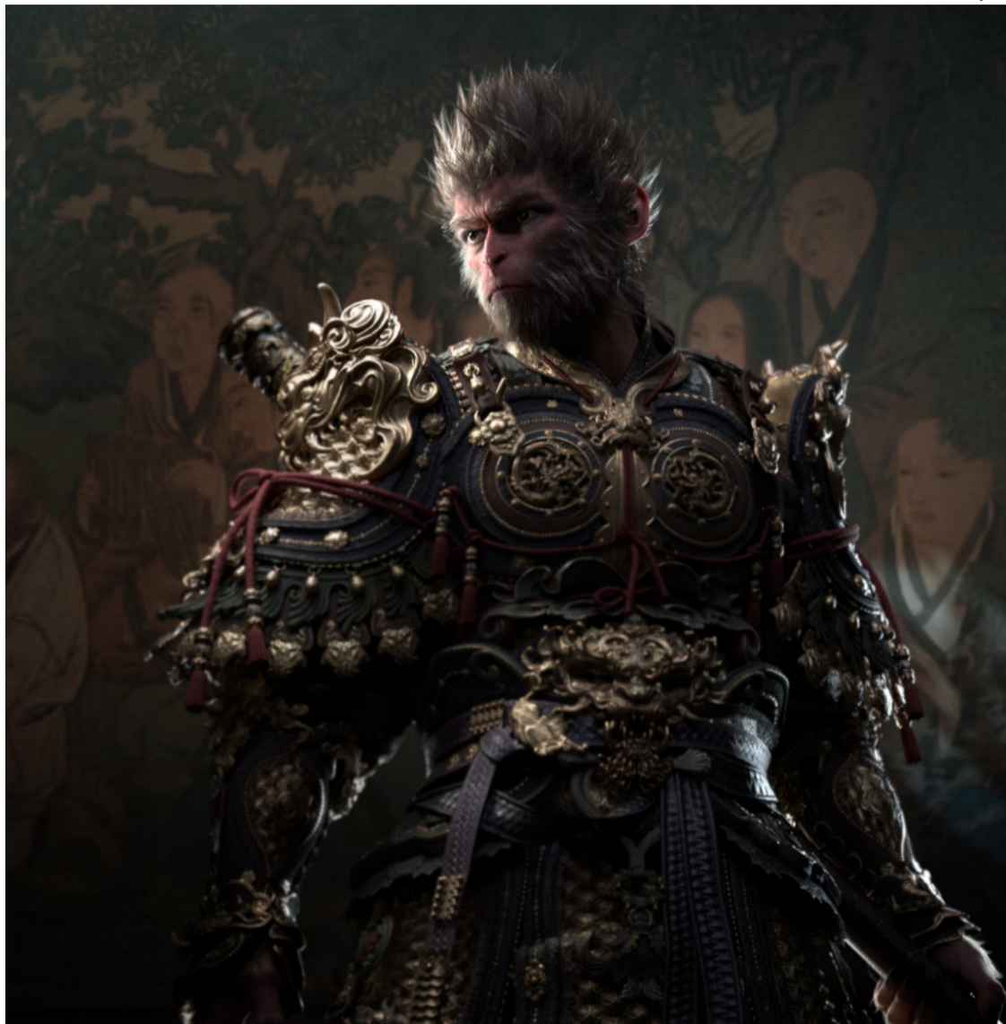
Produto entra para valer no mercado, mas indústria chinesa não tem tradição

Criado na Unreal 4 e depois migrado para o Unreal 5 - motor de jogo que serve a qualquer humano disposto a criar videogames -, o Black Myth: Wukong é mais suave e menos difícil do que um souslike - jo-